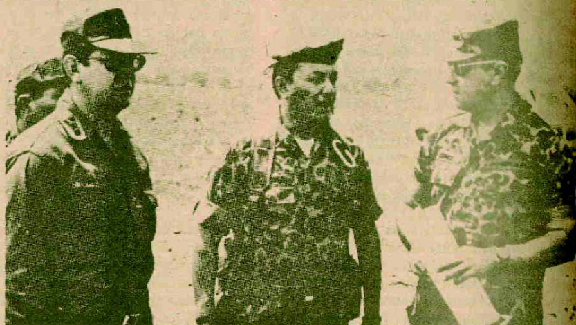
De izquierda a derecha, el señor Jefe del Estado Mayor Conjunto, el señor Comandante del Segundo Batallón de Infantería y el señor Comandante en Jefe de las Fuerzas Armadas de Honduras, dialogan en el campo de aterrizaje de Jamastrán.

cha, la antítesis de los resabios clasistas y oligárquicos que históricamente han sido causales directos de la degeneración y decadencia de los individuos y las colectividades humanas. Los hombres de nuestra época no podemos renunciar al derecho y al deber de esforzarnos por construir un mundo mejor, como patrimonio inalienable de la humanidad.